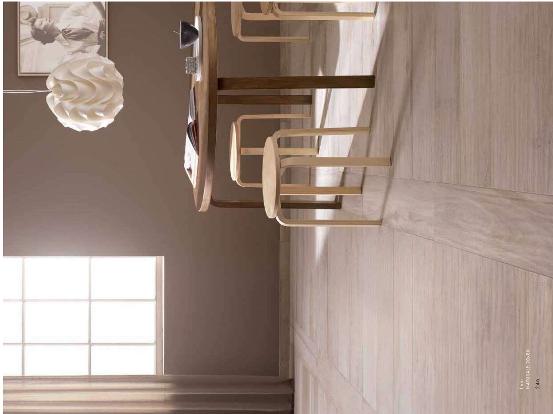
1151 NATURALE 20x80 246